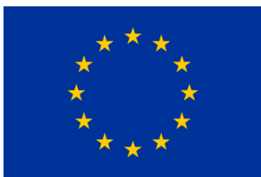
Cofinancé par l'Union européenne

L'emblème avec mention à utiliser est 18 :